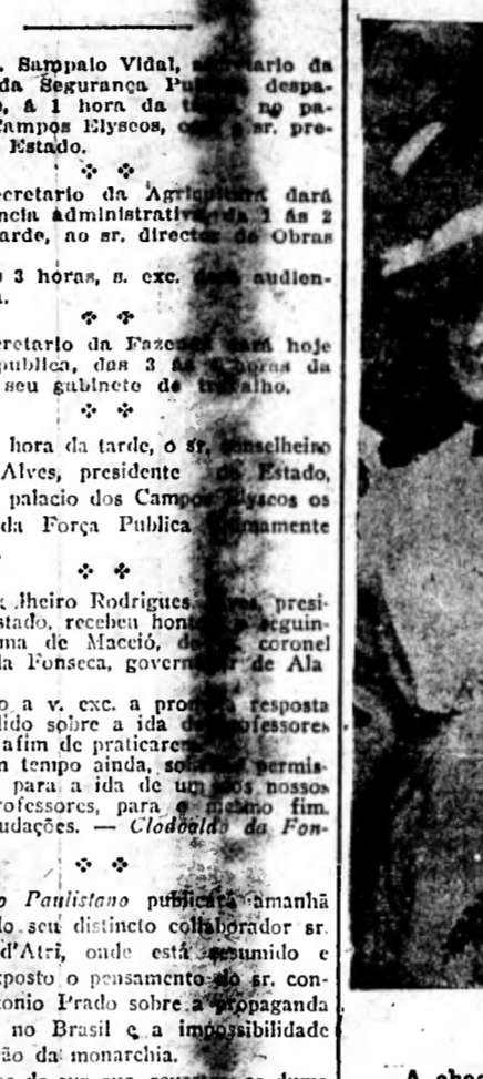
A chegada do brilhante escriptor: — á direita, Coelho Netto; á esquerda, suas exmas. esposa e irmã

de lymphá vacinica que s. exc. solicitou do governo de S. Paulo.