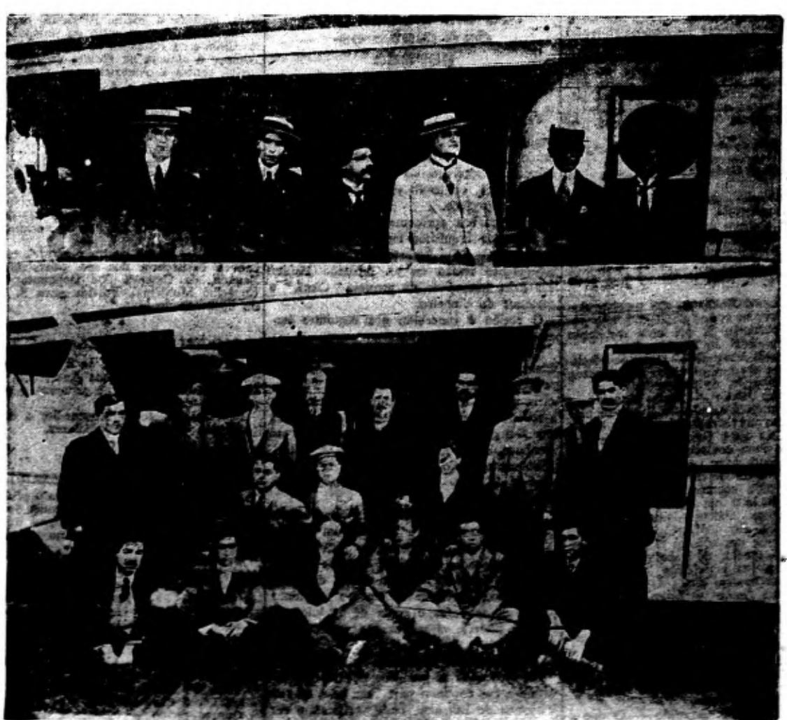
Em cima: Commissão da Liga do Rio — Em baixo: A valorosa equipe sul-americana photographada a bordo do Orcom, por occasião de sua passagem pelo porto de Santos