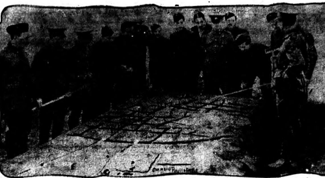
Um campo de batalha em miniatura, modelo de uma batalha feita no Beiton Park, em Grantham, para instrucao e demonstracao pratica do movimento das tropas, aos recrutas ingleses do exercito de lord Kitchener.