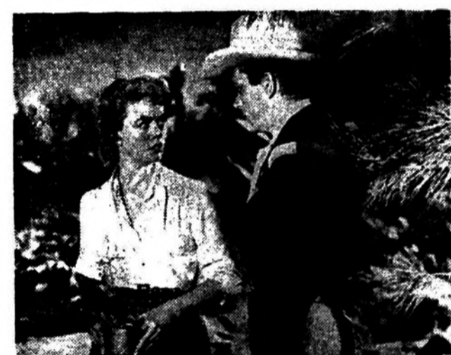
O personagem central do emocionante filme da Universal Internacional, 'Piastras do Ceu', cuja estreia será 2a-feira no Art Palácio...