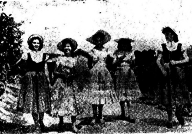
Em uma chácara de Vinhedo, rainha e princesas, estiveram com nossa reportagem, mostrando os parciais de sua festa