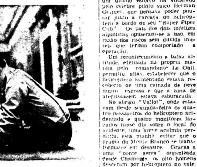
Encantadora fotografia do Príncipe Charles e da Princesa Anne, lendo na Galeria de Quadros do Palácio de Buckingham. A Princesa, com seis anos, veste um vestido de lã, branco com faixas de tã de lã azul e o Príncipe que acaba de completar oito anos veste uma calça de lã cinza e uma camisa azul.

Neste caso, aviziam-se o papel histórico, a política pertinz de grande estadista, Conrad Adenauer que, graças à sua energia férrea, extorquiu dos franceses esta concessão, em prol da própria França e da Alemanha, em benefício de toda a Europa, de toda a Ocidente. O primeiro "Anschlus" do Sarre, sob Hitler marcou a nova era do imperialismo nazista; esta segunda, sob Adenauer, abre caminho à cooperação democrática do mundo livre.